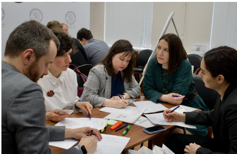
Рисунок 3. Работа команд во время стратегической сессии, организованной ИПРЭ РАН и ДОМ.РФ в Общественной палате Санкт-Петербурга, 9 июня 2025 года.